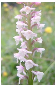
Cypripedium calceolus i Gymnadenia odoratissima , espècies rares i en perill presents al Catllarès